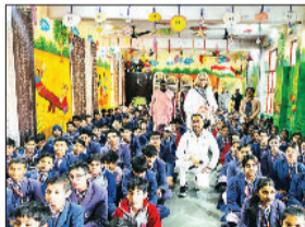
सोनीपत। दिल्ली विद्यापीठ में कार्यक्रम के दौरान अतिथि के साथ विद्यार्थी साथ में संचालक एवं अन्य।