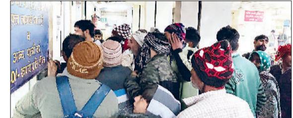
सोनीपत। नागरिक अस्पताल में टीकाकरण कक्ष के बाहर अपनी बारी का इंतजार करते मरीज।

शहरभर में आवारा कुत्तों व बंदरों ने उत्पात मचा रखा है। लोगों को गलियों से गुजरना दुभर हो गया है। गलियों से निकलते हुए कुत्ते पीछे से आकर लोगों को काट रहे हैं, वहीं बंदरों का आतंक भी बढ़ता जा रहा है। ऐसे में लोगों का घरों से निकलना मुश्किल हो रहा है। गलियों व सड़कों पर कुत्तों के झुंड राहगीरों व वाहन चालकों को काटने को दौड़ते हैं। ऐसे में रोजाना नागरिक अस्पताल में कुत्तों के काटे जाने वाले मरीजों की तादाद 15 से ज्यादा हो गई है। उधर प्रशासन आवारा कुत्तों व बंदरों के उत्पात पर कतई भी गंभीर नहीं है।