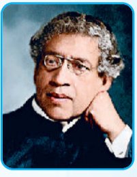
जगदीश चंद्र बसु

रेडियो के विकास में भारत का योगदान: वैसे तो पहला व्यावहारिक रेडियो 1895 में गुग्लियो एल्मो मार्कोनी द्वारा बनाया गया था, लेकिन भारतीय वैज्ञानिक जगदीश चंद्र बसु ने 1895 में बिना तार के सिग्नल भेजने का प्रदर्शन कर दिया था। भारत में पहला रेडियो प्रसारण जून 1923 में बॉम्बे रेडियो क्लब द्वारा किया गया था। अपने देश का ऑल इंडिया रेडियो 99 प्रतिशत जनसंख्या तक पहुंच के साथ दुनिया के सबसे बड़े प्रसारकों में से एक है।