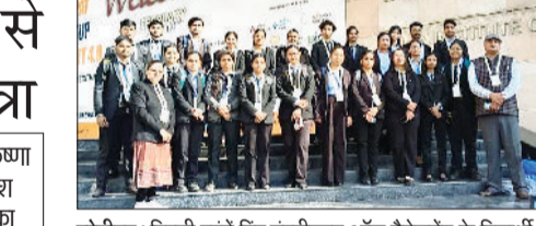
सोनीपत। दिल्ली पहुंचे हिंदू इंस्टीट्यूट ऑफ मैनेजमेंट के विद्यार्थी।