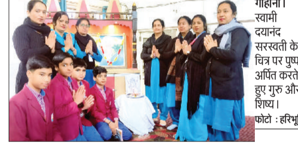
गोहाना। स्वामी दयानन्द सरस्वती के चित्र पर पुष्प अर्पित करते हुए गुरु और शिष्य।