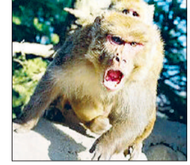
हरिभूमि न्यूज सोनीपत