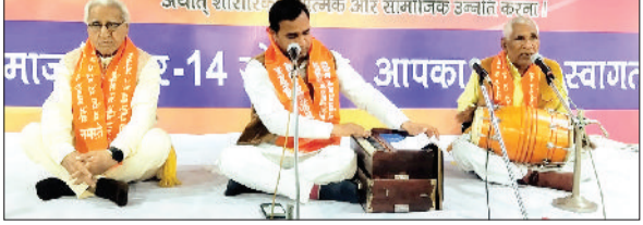
सोनीपत। कार्यक्रम के दौरान मंचासीन आर्य समाज के विद्वान।