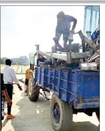
सोनीपत। रामनगर स्थित सीआरजेड विद्यालय में खेल का सामान ट्रैक्टर-ट्राली में लोड करते खिलाड़ी।

रामनगर स्थित सीआरजेड वरिष्ठ माध्यमिक विद्यालय में करीब 15 साल से चल रहा हाँकी प्रशिक्षण केंद्र वीरवार को बंद कर दिया गया। प्रशिक्षण केंद्र के अचानक बंद होने से कई तरह के सवाल उठ रहे हैं। मामला खेल मंत्री से लेकर खेल विभाग के कमीश्नर व जिला खेल अधिकारी के दरबार में भी पहुंच चुका है। फिलहाल हाँकी प्रशिक्षण केंद्र बंद होने का कारण स्कूल प्रबंधन व प्रशिक्षक के बीच आपसी मनमुटाव माना जा रहा है। ऐसे में प्रशिक्षक ने उन्हें मुख्यालय की ओर से खिलाड़ियों अभ्यास के लिए दिए गए सामान को उठाकर गोहाना रोड स्थित सुभाष स्टेडियम में पहुंचा दिया गया है। सरकार की ओर से सीआरजेड वरिष्ठ माध्यमिक विद्यालय में करीब 15 साल से सरकारी हाँकी प्रशिक्षण केंद्र का संचालन किया जा रहा था। वर्तमान में केंद्र में करीब 100 खिलाड़ी हाँकी का प्रशिक्षण ले